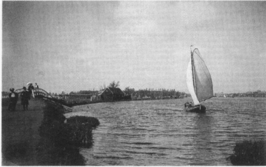
Het Jaagpad bij de Schinkel op een foto van rond 1900 van Bernard F. Eilers.

bemalingswerk uitgevoerd. Deze molen is door storm verloren gegaan. Er is sprake geweest van herbouw van de Koenenmolen. Het zou mooi zijn als deze molen zou terugkeren aan het Nieuwe Meer. Dat zoiets mogelijk is bewijst de molen aan het Spaarne in Haarlem, die ook in het begin van de twintigste eeuw is afgebrand en enkele jaren geleden uit de as is herrezen.