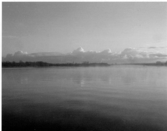
Wijds uitzicht met wolken weerspiegelend in het Nieuwe Meer

We volgen de Riekerweg en gaan linksaf het Anton Schleperpad op. Door de Oeverlanden langs het nieuwe NME-centrum lopen we naar de aanlegsteiger van de veerpont en steken over naar het Amsterdamse Bos. De Oeverlanden stonden begin jaren tachtig op de nominatie bebouwd te worden als aanvullende bouwlocaties. Politici wilden destijds snel de woningnood oplossen, die door de krakersrellen rond 1980 hoog op de politieke agenda was komen te staan. Zij beschouwden deze stadsrand als leeg terrein en waren weinig ontvankelijk voor natuurwaarden en landschappelijke schoonheid. De vereniging "De Oeverlanden Blijven!" heeft met succes gestreden voor behoud, en zet zich nog steeds in voor natuur en recreatie in dit gebied. Met het Nieuwe Meer aan de linkerzijde lopen we langs polder Meerzicht met behoorlijk wat weidevogsels. Op de Koenenkade slaan we links af. We blijven de Koenenkade volgen, dat wil zeggen na zo'n 500 meter weer links af. Nu komt het Nieuwe