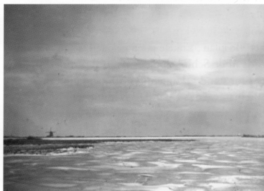
Wintergezicht vanaf de Amstelveense weg naar het westen over een bevroren Nieuwe Meer, links de Koenenmolen.

Over de overblijfselen van het Karnemelksegat, in de volksmond de banaan geheten, ligt een dubbele klapbrug. De sluis laat goed het niveauverschil zien tussen het Nieuwe Meer en het Amsterdamse Bos, ofwel de Buitendijkse Buitenveldertsche polder. Hier heeft tot 1919 de Koenenmolen gestaan, die is afgebrand na blikseminslag. Daarna heeft een Amerikaanse windmolen tot begin mei 1940 het