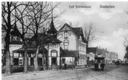
Uitspanning Schinkelhaven, Amstelveense weg 4a kijkend richting Overtoom, rechts Vondelpark

Linksaf de Sloterkade op. Even kijken op het Jacob