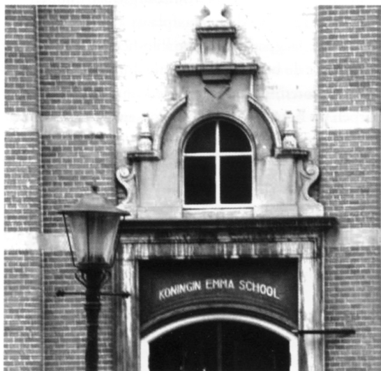
Koningin Emma School Passeerdersgracht

We lopen langs de Krakeling over de Koekjesbrug de Bosboom Toussaintstraat in richting Constantijn Huygensstraat. De bouwput van het Swammerdam-instituut is nog goed te zien. Jan Swammerdam