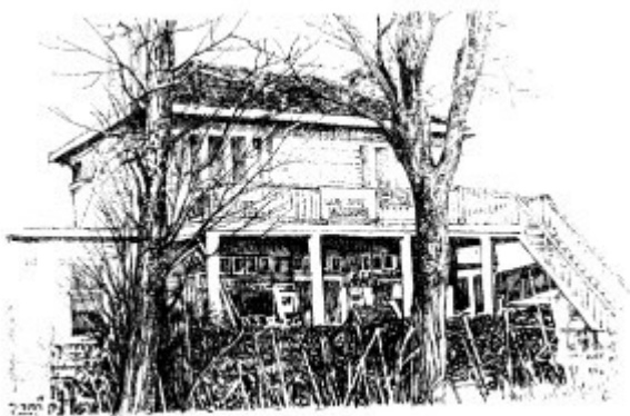
Café Opoe langs het Jaagpad

De Riekerpolder, waar de Noordelijke Oeverlanden deel van uit maken, behoort tot het Hollands-Utrechtse veengebied. De Riekerpolder ontstaat in 1636 wanneer de Dijkgraaf en de Hoge Heemraden van Rijnland een vergunning geven aan de Ingelanden van Sloten, de Vrije Geer en Rieck. In de polder wordt een watermolen gebouwd om deze te bemalen. Omdat de Riekermolen alleen werkt als het waait en de techniek niet stil staat, bouwt de gemeente in 1932 een motorisch aangedreven pomp waardoor de molen buiten gebruik komt. De molen blijft echter intact en staat gedurende de oorlogsjaren gereed om de polder te bemalen, wanneer de brandstoftoewijzing stopt. De Nieuwe Meer is een al eeuwenoude veenkreek, die in het zuiden grenst aan de Haarlemmermeer en zich in het noorden versmalt in de Schinkel. Bij de drooglegging van de Haarlemmermeer in 1850 blijft de Nieuwe Meer gespaard. De Nieuwe Meer wordt onderdeel van een belangrijke scheepvaartroute. Producten uit de Haarlemmermeer worden via de Nieuwe Meer naar de Schinkel vervoerd, en van daaruit over heel Amsterdam verspreid. In de tweede helft van de 19e eeuw wordt een klein gedeelte van de noordelijke oever ingepolderd. Voorheen stonden de sloten van het weidegebied in open verbinding met de Nieuwe Meer. Op de dijk wordt het Jaagpad aangelegd. Dit wordt een geliefde route voor de omwonenden. Ze bezoeken de befaamde uitspanning 'Opoe' langs het Jaagpad, terwijl de Nieuwe Meer wit ziet van de honderden zeilbootjes.