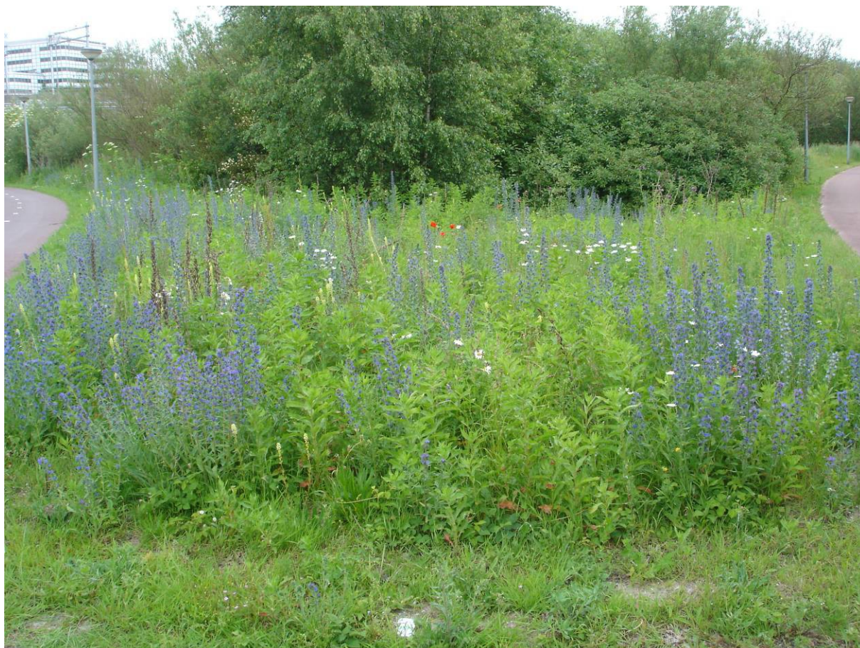
Explosie van slangenkruid, wilde reseda, margriet en klaproos in de oksel van 2 fietspaden bij de Oude Haagseweg.