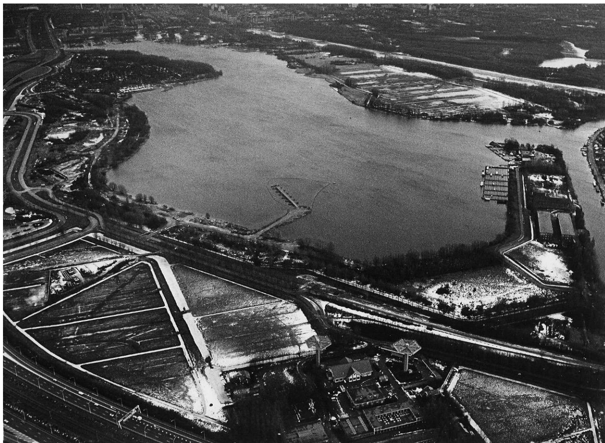
Overzichtsfoto naar het zuidoosten, van Riekerpolder, Oeverlanden, Nieuwe Meer en Amsterdamse Bos.