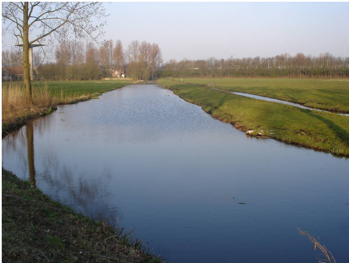
De Molenwetering, diagonaal door het laatste restje Riekerpolder.