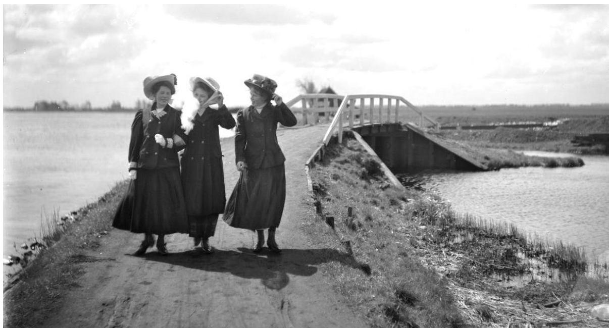
Jaagpad bij het eerste bruggetje, ter hoogte van het Spijtellaantje, naar het zuiden (Riekerpolder) gezien.