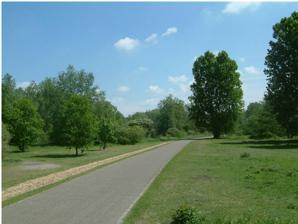
Avondstemming aan het Anton Schleperspad. Diep eronder stroomt het gas uit Slochteren.