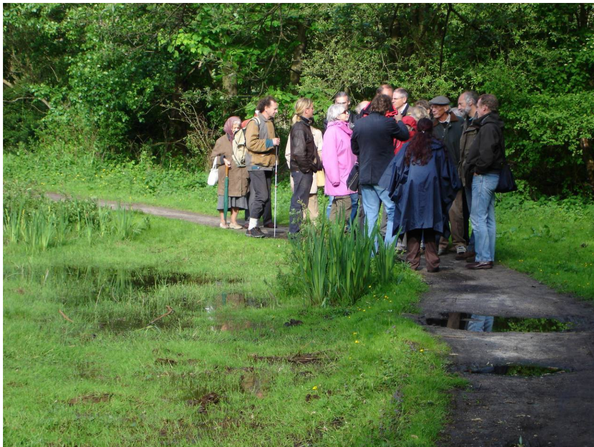
Excursie ter gelegenheid van de viering van het 25-jarig jubileum met leden van de vereniging en enkele leden van de stadsdeelraad. 2009