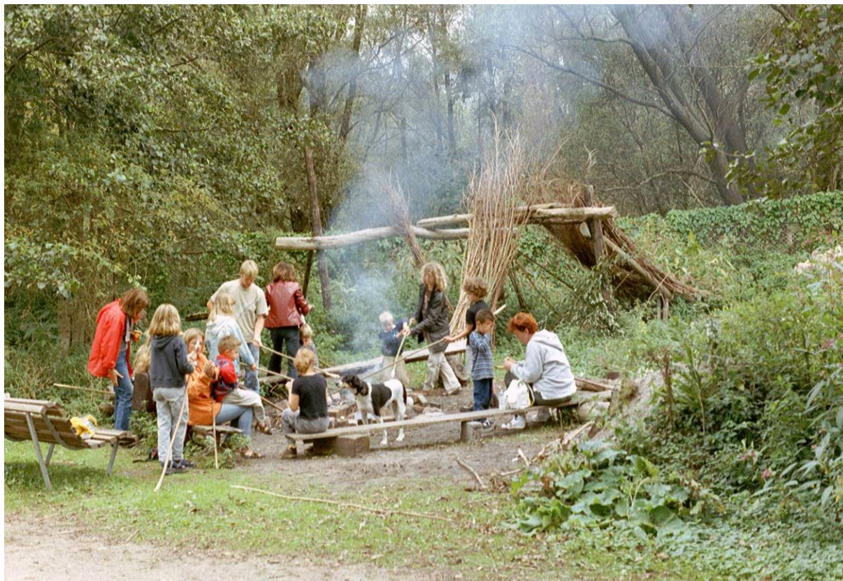
Een dagje leren in de natuur wordt besloten met broodbakken in het vuur op het depot van de Oeverlanden. 2010