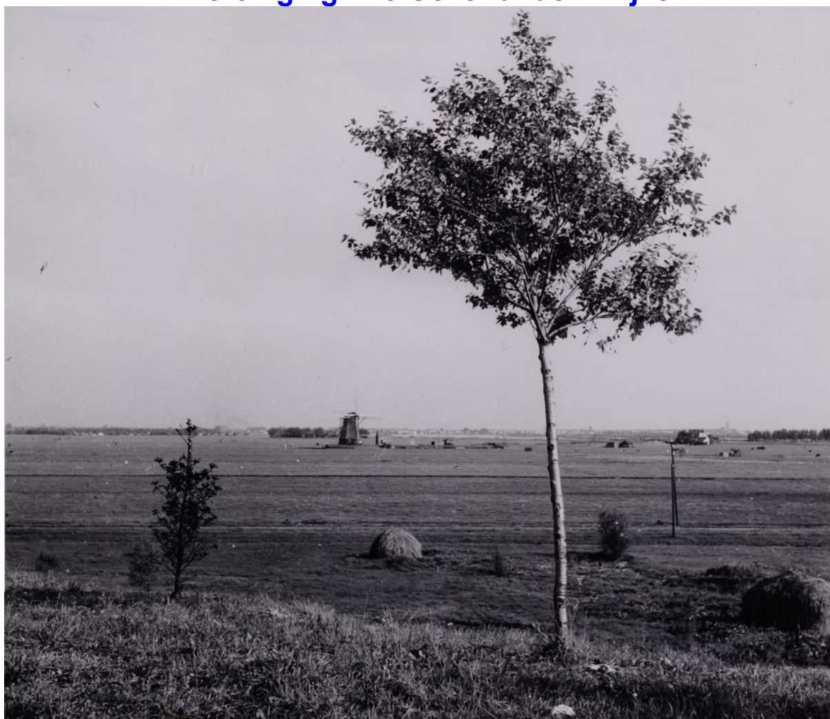
Vanaf de pas aangelegde Haagseweg zicht over de Riekerpolder naar 't Nieuwe Meer. Midden Riekermolen, rechts Cafe Opoe. 1940