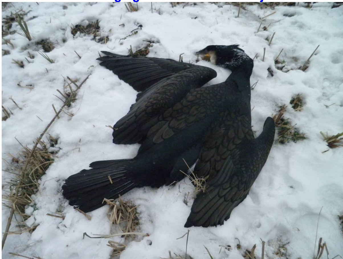
Aalscholver, na een zeer koude periode gevonden langs het Jaagpad, de snavel begraven in de sneeuw.