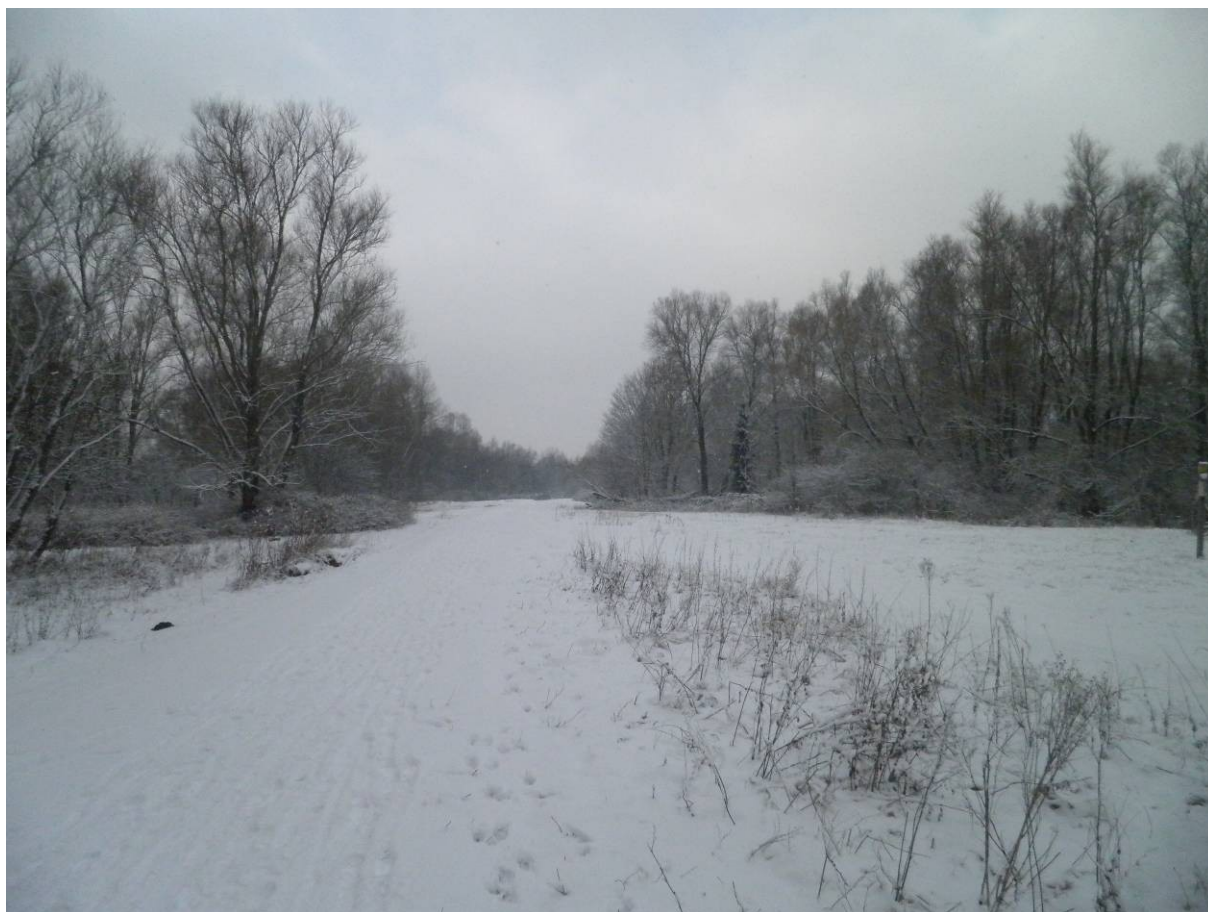
Het Anton Schleperpad gezien naar het westen. De laatste jaren valt er meer sneeuw en is dit plaatje vaker te zien.